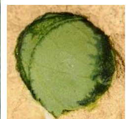
Bouchon de fermeture constitué de morceaux de feuilles empilés