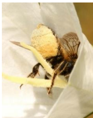
Femelle avec brosse ventrale remplie du pollen blanc des campanules