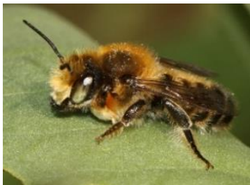
Au repos, le mâle replie souvent ses pattes avant sous sa tête

La mégachile des jardins est une abeille coupeuse de feuille. Elle découpe des morceaux de feuilles dans certains arbres ou arbustes (chêne, charme, bouleau, érable, cornouiller, rosier, églantier, framboisier, symphorine...) parfois aussi dans des lianes (chèvrefeuille) ou des plantes herbacées (liseron) pour construire les cellules et le bouchon de fermeture de son nid.