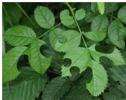
Découpes de forme ovale et ronde dans des feuilles d'églantier