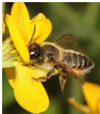
Femelle butine lotier