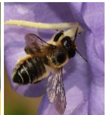
Femelle butine campanule à feuilles de pêcher