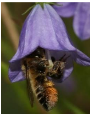
Femelle butine campanule à feuilles rondes